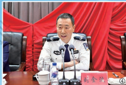
③6月5日，副省长侯浙珉到长春市东南污水处理厂检查“世界环境日”环保设施向公众开放情况。 ④6月7日，副省长、公安厅厅长刘金波在省公安厅参加“不忘初心、牢记使命”主题教育工作会议。