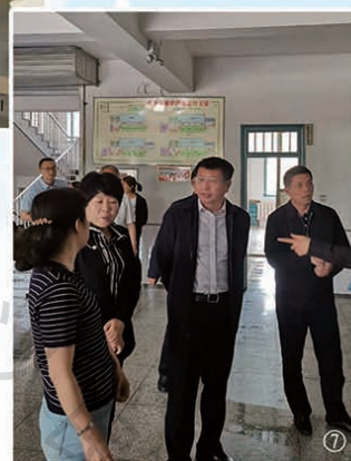
⑤6月1日，副省长李悦参加“六一”关爱慰问活动。 ⑥6月15日，副省长朱天舒在参加中俄博览会期间到哈尔滨电气集团公司考察洽谈合作项目。 ⑦6月2日，副省长安立佳在延边州检查高考安全准备情况。