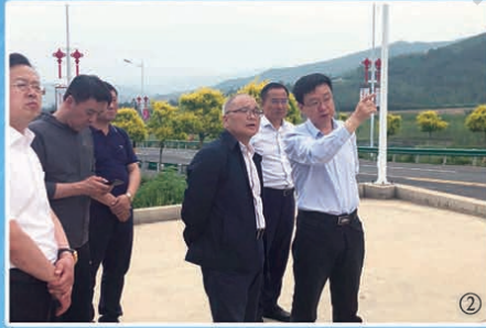
①5月29日，省委常委、常务副省长吴靖平参加省境人大全省营商环境工作专题询问会议。 ②6月5日，副省长石玉钢在吉林市就重点项目建设、文化旅游发展等工作进行调研。